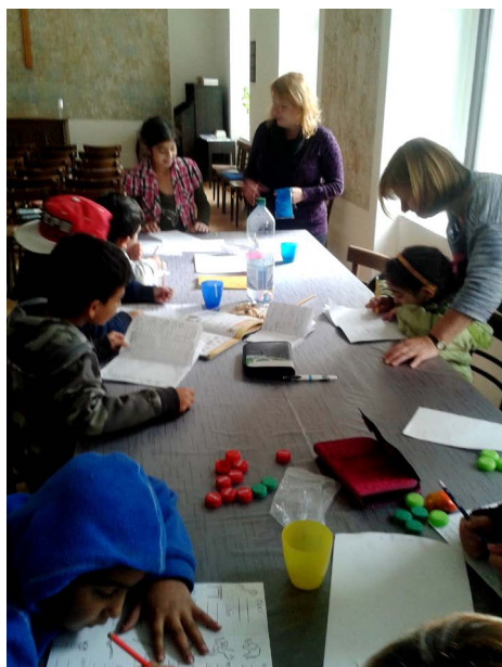
Skupinové doučování s dobrovolnicemi.

Doučování poskytujeme dvěma formami, jednak jako skupinový kroužek a pak individuálně přímo v rodinách. Skupinové doučování probíhá jednou týdně, 2 hodiny odpoledne, a je zaměřeno na přípravu domácích úkolů a pomůcek do školy, individuální doplnění vědomostí a také motivační aktivity. Hlavní lektorce kroužku tu vypomáhají vždy 1 - 2 dobrovolníci. Individuální doučování probíhá přímo v domácnostech, kdy s dítětem za přítomnosti rodiče kontinuálně pracuje vždy jeden dobrovolník. Tento typ doučování umožňuje pracovat s dítětem více do hloubky a zároveň motivovat celou rodinu ke vzdělávání a participaci na školní docházce, ale i na mimoškolních aktivitách dítěte. Důležitou součástí programu jsou