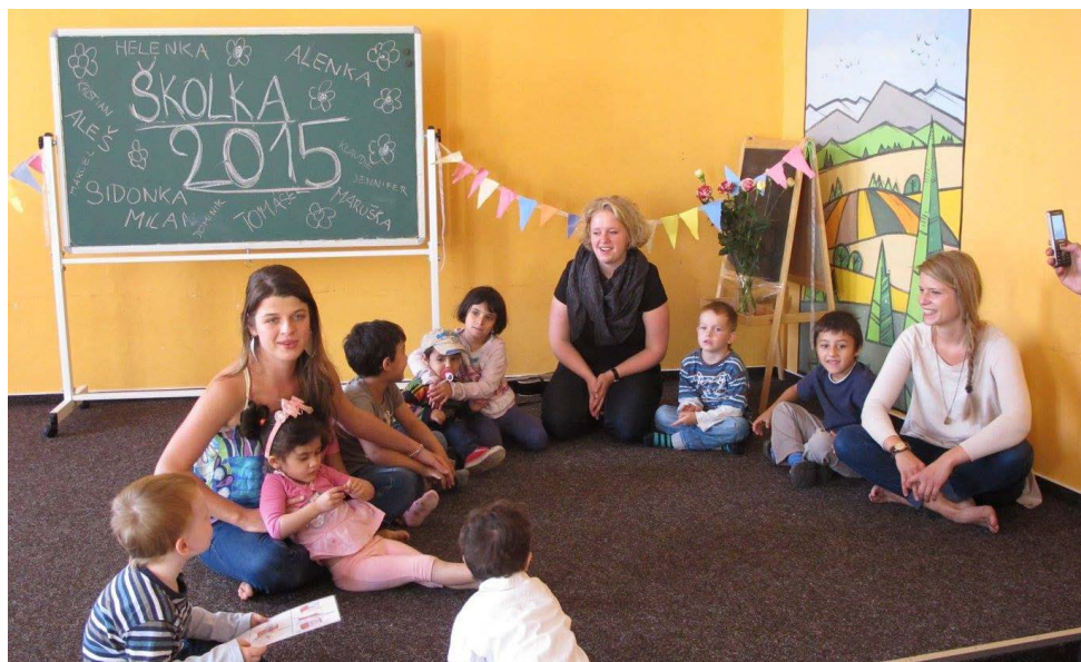
Besídka předškolního kroužku.