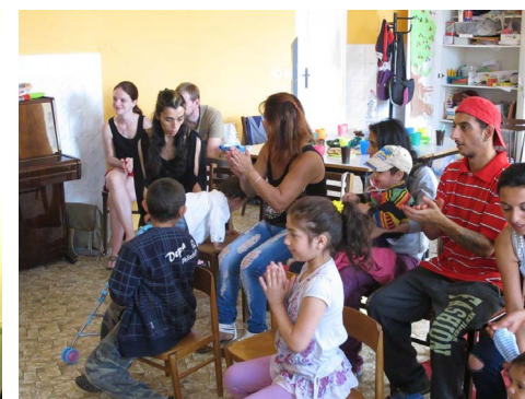
Rodiče na besídce předškolního kroužku.