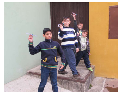
Spolupráce, soutěže i tvoření, to vše zahrnují naše víkendovky.