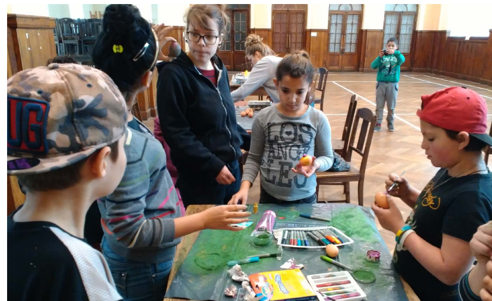
Víkendové aktivity poskytneme nově i ve Slaném.